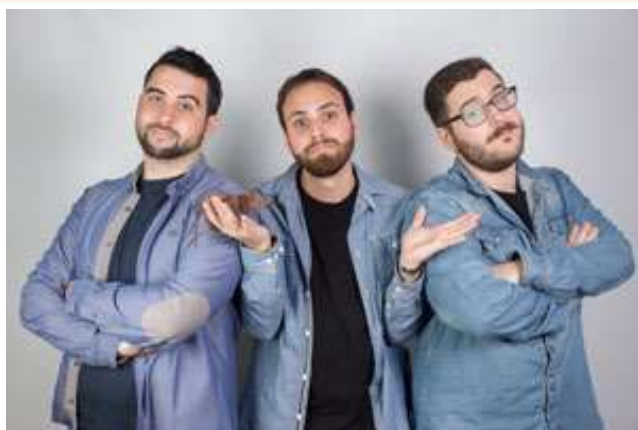
Ad Absurdum. Pregoneros Feria del libro de Murcia 2024