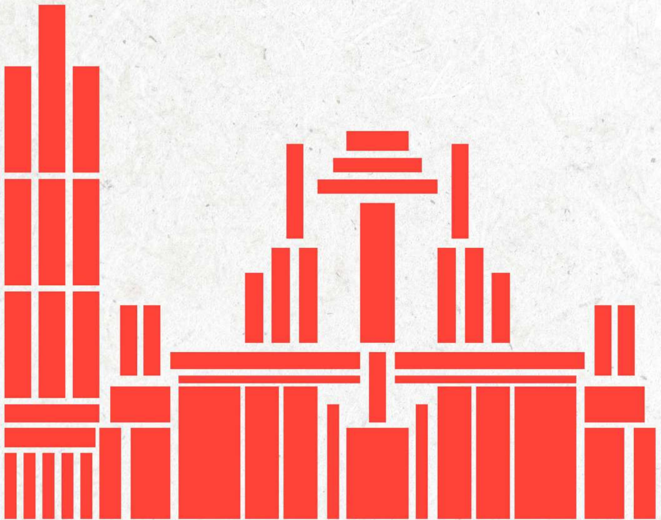
CATEDRAL DE MURCIA LOS GRANDES CLÁSICOS