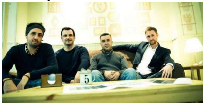
Cuatro de los integrantes del blog literario El quinto libro

20 h Presentación Distopía volumen IV Minerva en llamas de El Quinto libro, edita Circulo Rojo. Ubicación: Pabellón Las Anas.